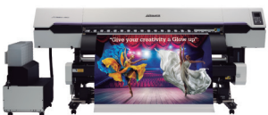
JV330 Series CJV330 Series